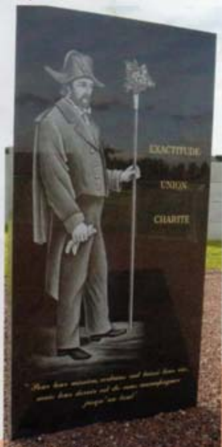
La stèle des Charitables