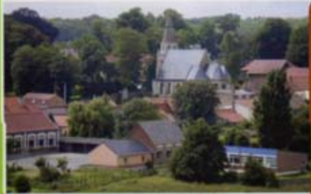
Nouvelles toilettes de l'école