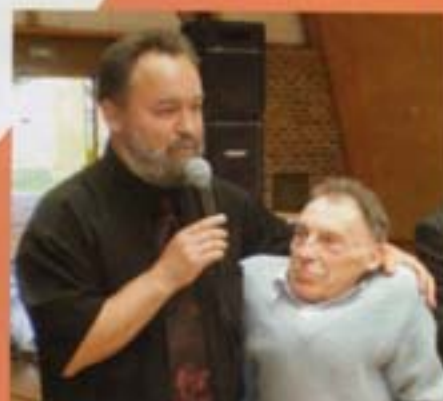
Honneur à nos anciens