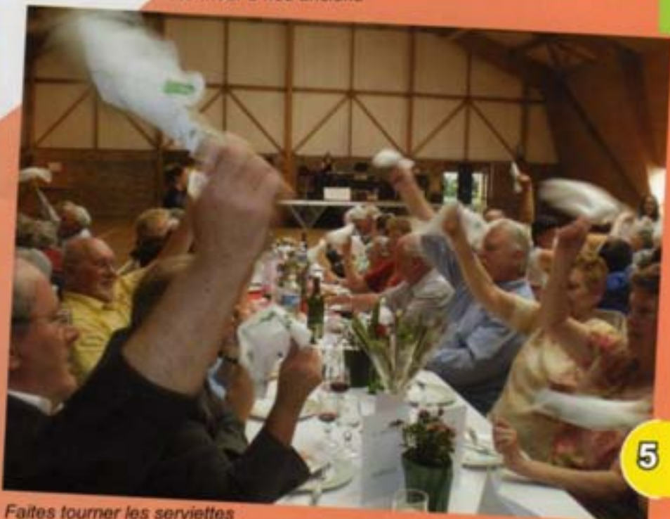
Faites tourner les serviettes