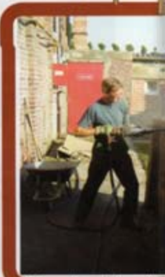
Rénovation de la salle