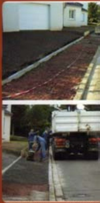
Trottoir de la rue Jules Verne