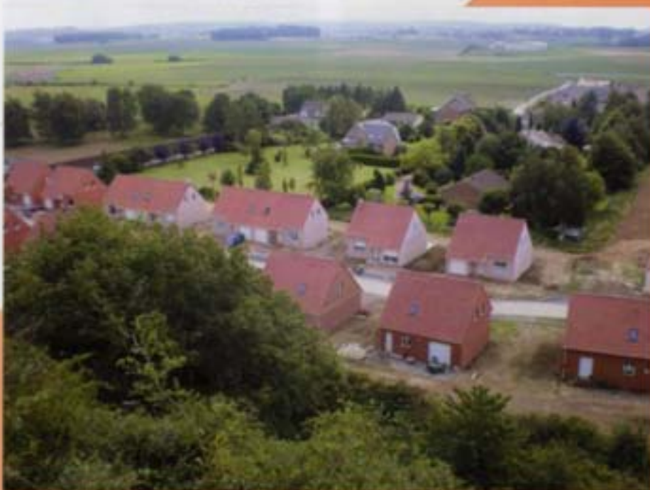
La nouvelle résidence Vipérine

Bientôt, rue Mercier avec Pas de Calais Habitat et aux Paturelles, de nouvelles constructions vont sortir de terre.