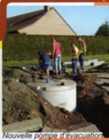
Nouvelle pompe d'évacuation