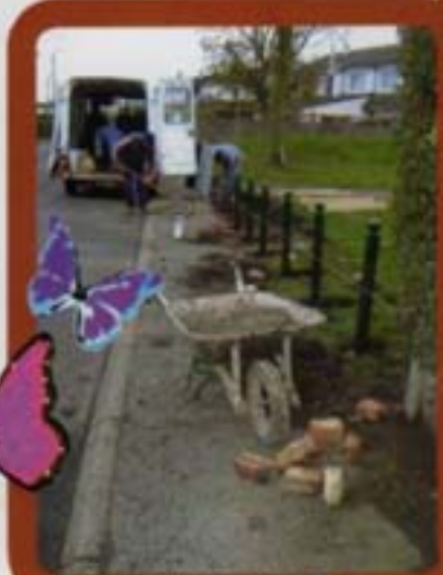
Clôture d'espace vert