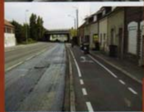
Feux route nationale