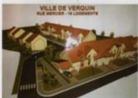
La future résidence rue Mercier

Pas d'augmentation d'impôts depuis 2001. L'environnement