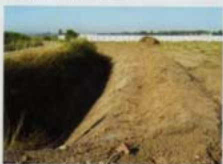
L'aménagement du terrain

La dernière demeure. Il fallait créer une harmonie, une ambiance propice.