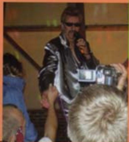
la St Jean