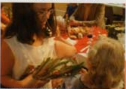
La distribution du muguet