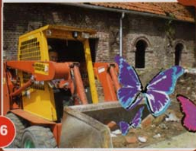
La future salle des mariages