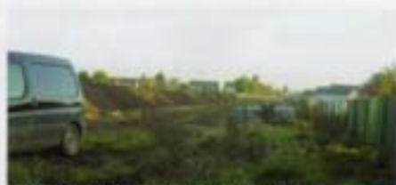
Résidence de la Bombarde