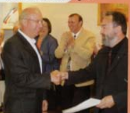
Médaille du travail