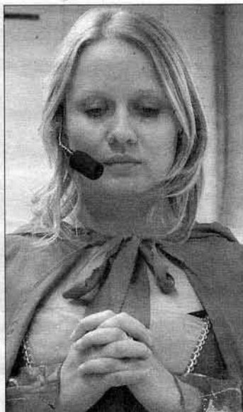
Françoise d'Aubigné, l'épouse secrète de Louis XIV.

« Certains sont là depuis le début - le noyau de l'association -, d'autres nous ont rejoints au fil des productions », explique le pilier de cette troupe quasi familiale. Son père et son grand-père