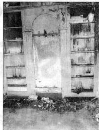
Les dégâts sont importants.